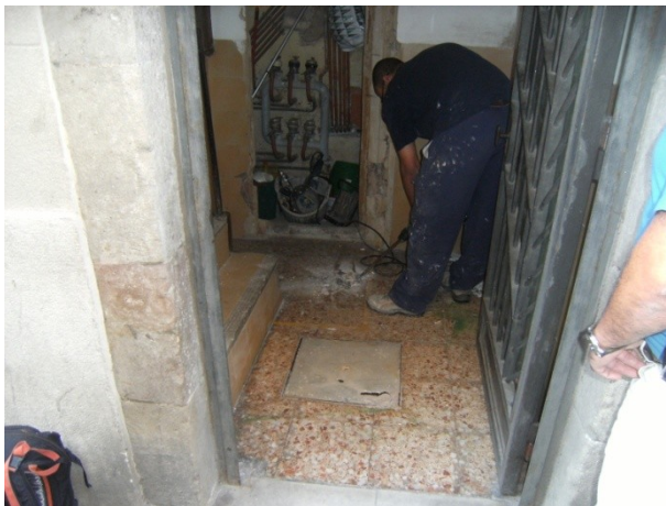
FOTO 3. Inici de les tasques d'excavació