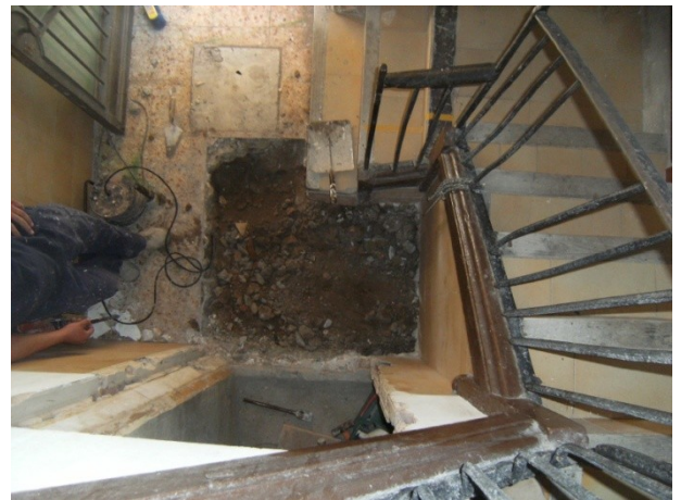
FOTO 4. Vista general un cop enretirat el paviment contemporani