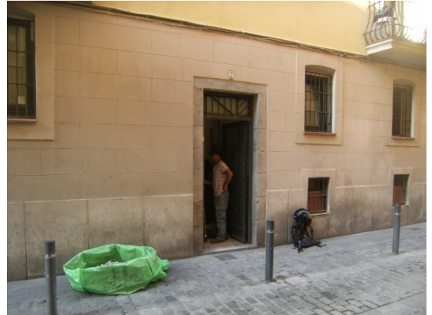
FOTO 2. Portal de l'immoble