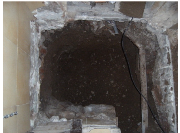
FOTO 8. Final d'excavació