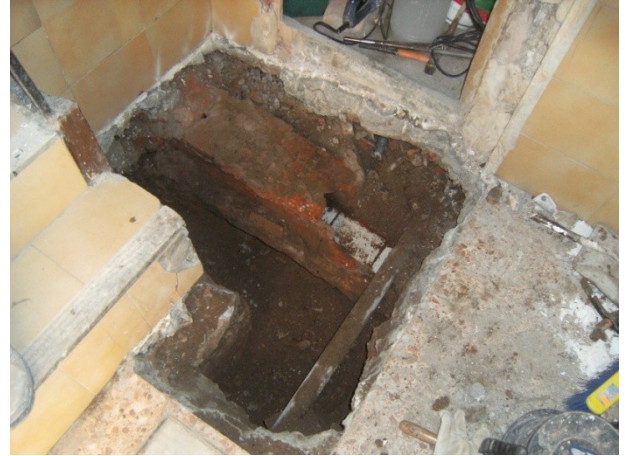
FOTO 6. Claveguera moderna UE 5