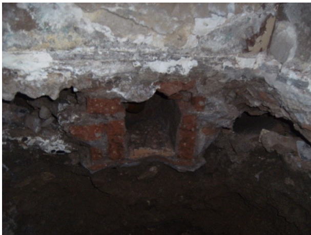
FOTO 7. Detall de la claveguera UE 5