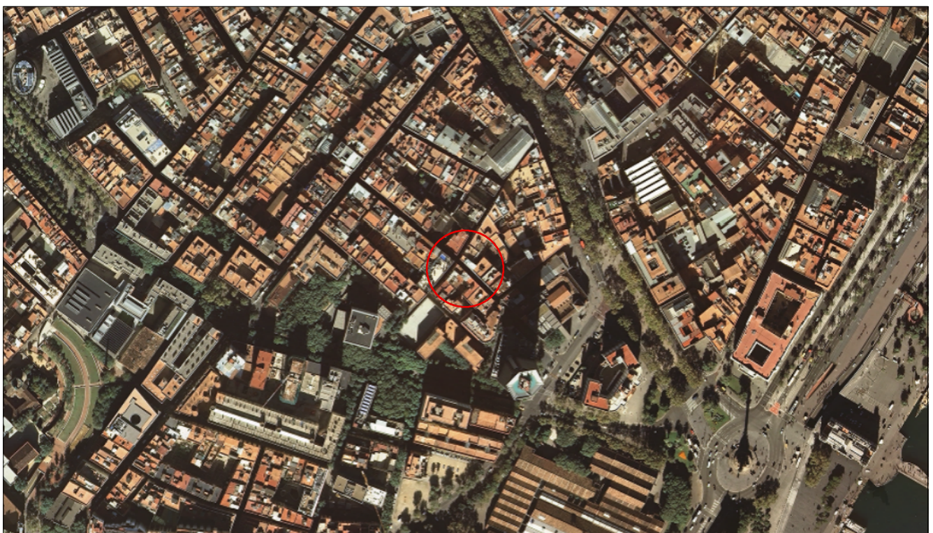
Ortofotoimatge Escala 1:5.000