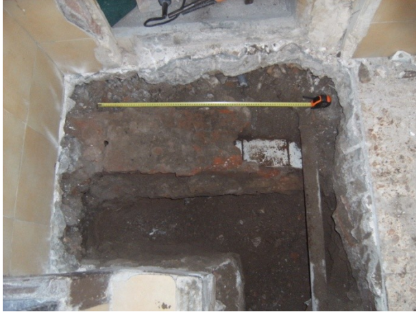
FOTO 5. Claveguera moderna UE 5