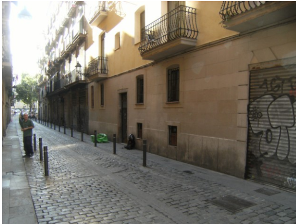
FOTO 1. Vista de la finca número 2 del carrer de Montserrat