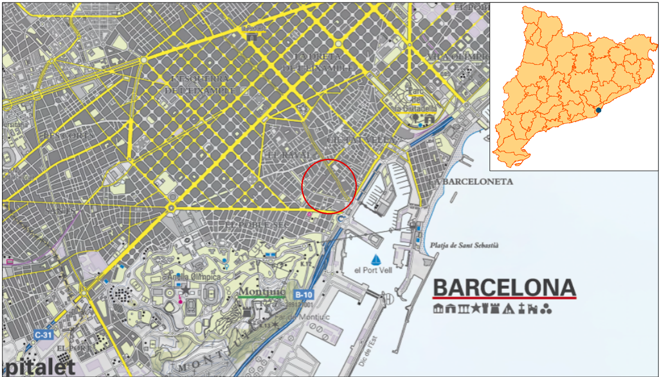
Mapa topogràfic Escala 1:50.000